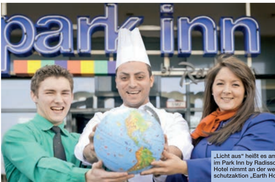
„Licht aus“ heißt es am 31. März 2012 im Park Inn by Radisson Bielefeld: Das Hotel nimmt an der weltweiten Klimaschutzaktion „Earth Hour“ teil.