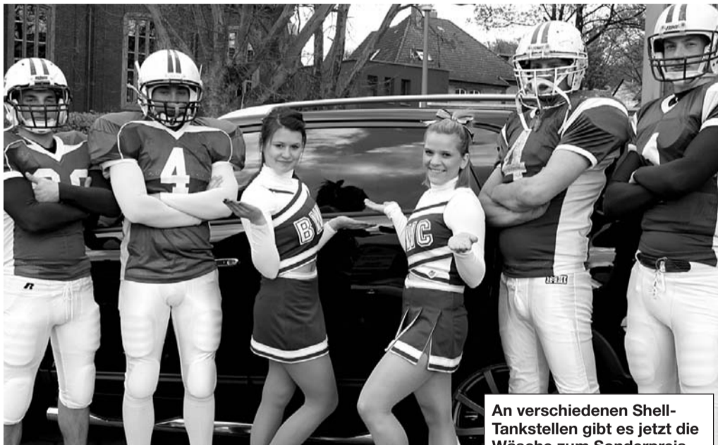
An verschiedenen Shell-Tankstellen gibt es jetzt die Wäsche zum Sonderpreis.

Mitte. Ab sofort gibt es bei dem Partner der Bielefeld Bulldogs, Shell J.Enderweit, die kann dieses Programm nutzen. Natürlich gilt das auch für alle, len von J.Enderweit an der Egerschen Straße, Detmolder