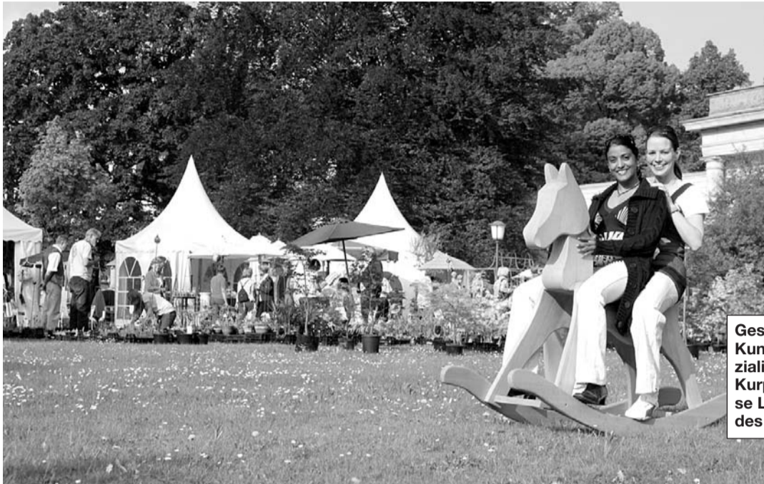
Geschmückte Pagodenzelte, Kunst, Kultur, kulinarische Spezialitäten und der Charme des Kurparks garantieren, dass diese Landpartie zu einer Oase des Wohlbefindens wird.

d'élégance“ zu werden, eine „Jagd um Punkte“ mit Schnelligkeits- und Geschicklichkeitsfahrten auf historischen Gespannen. Die Landpartie ist von Donnerstag bis Sonntag täglich von 10 bis 19 Uhr geöffnet. Hunde dürfen angeleint mit in den Kurpark.